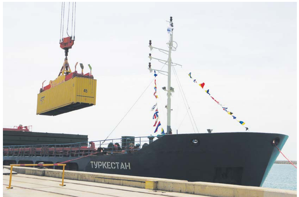
Қазақстандық тұңғыш «Түркістан» фидерлік кемесі сапарға шықты