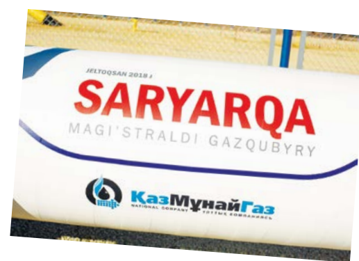
«Сарыарқа» газ құбырының құрылысы аяқталды