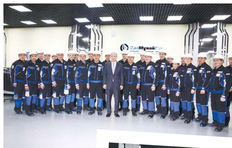
Мемлекет басшысы Қасым-Жомарт Тоқаев Павлодар мұнай-химия зауытында болды