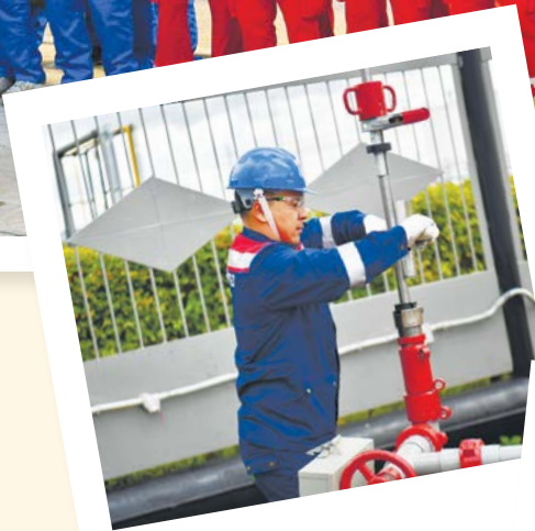
«Үздік маман – 2019» – Татарстанда