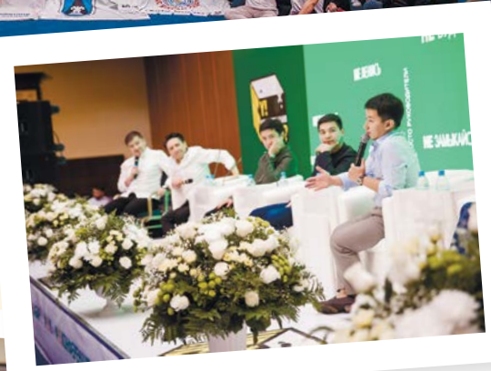
ҚМГ Жастар форумы: жаңашылдық жетістікке жетелейді