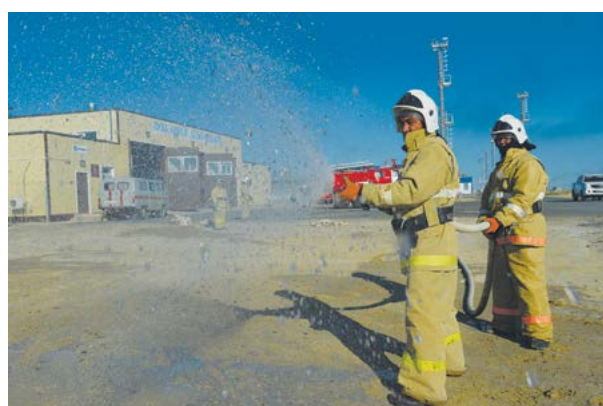
«Қаламқас» кен орнында шыққан өрт ауыздықталды