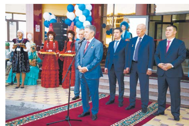
Атырауда «Каспиймұнайгаз» филиалының жаңа кеңсесі ашылды