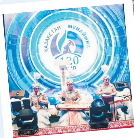
Қазақ мұнайының 120 жылдығы кең көлемде атап өтілді