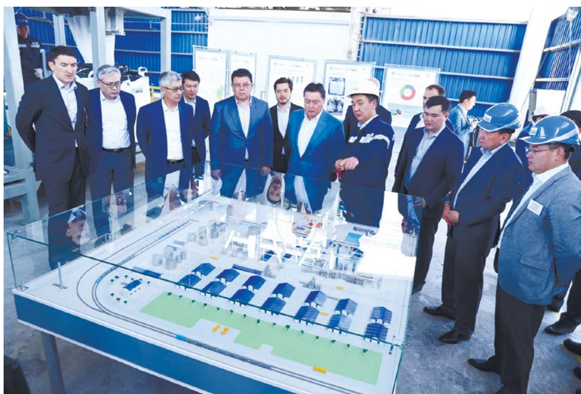
ҚР Премьер-Министрі А.Мамин Атырау мұнай өңдеу зауытына және «CASPI BITUM БК» ЖШС-не жұмыс сапарымен барды