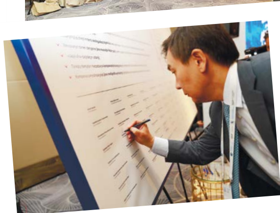
«ҚазМұнайГаз» ҰК АҚ бас директорларының мерейтойлық V форумы