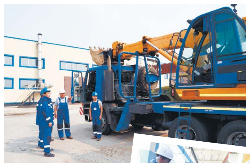
«ҚазТрансОйл» кәсіпорындарында 420 студент ақылы тәжірибеден өтті