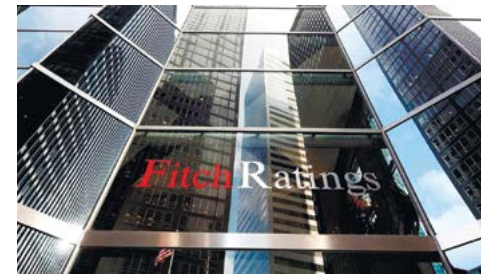
Fitch Ratings ҚМГ дербес кредит төлеу қабілеті рейтингін «BB-» деңгейіне дейін көтерді, ұзақ мерзімді рейтинг «BBB-» деңгейінде расталды, болжам «Тұрақты»