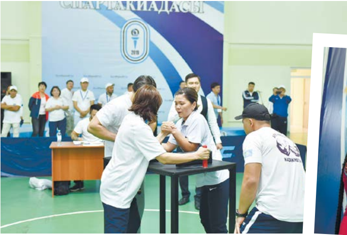
ҚазМұнайГаз Спартакиадасы – 2019