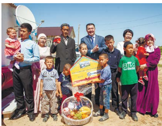
Ембіліктер 8 баспананың кілтін тапсырды