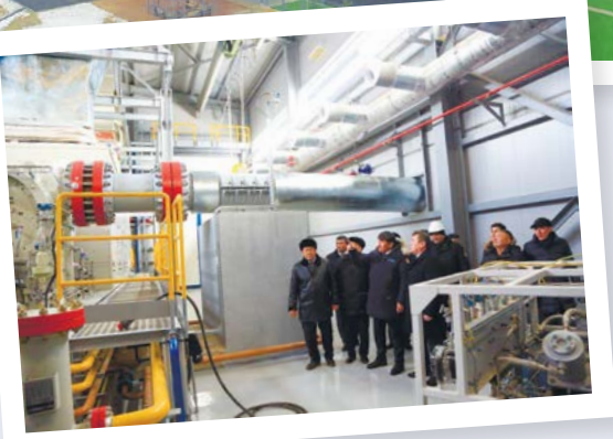
«Қорқыт Ата» компрессорлық стансасы іске қосылды