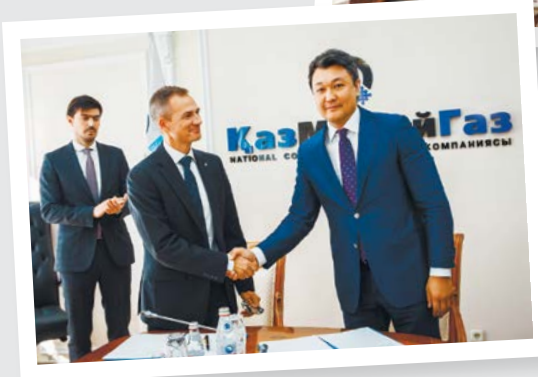
«ҚазМұнайГаз» бірнеше жетекші компанияларымен ынтымақтастық орнатты. Олар: Socar, BP, Эни, Тоталь, ЛУКОЙЛ, Equinor, Татнефть, Linde AG