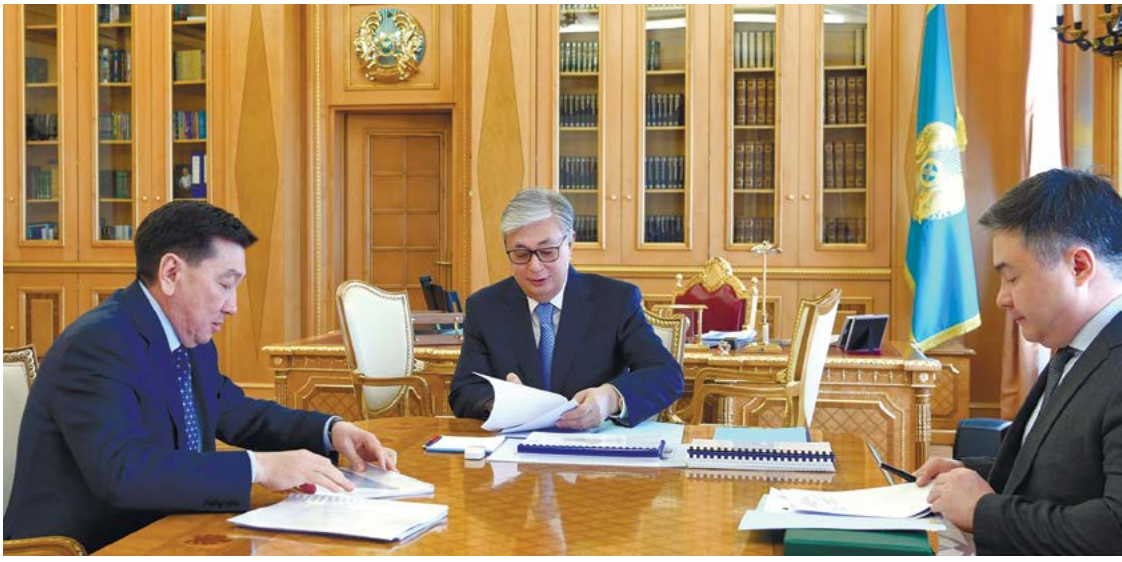
Қазақстан Президенті Қасым-Жомарт Тоқаев «ҚазМұнайГаз» ҰК АҚ Басқарма төрағасы Алик Айдарбаевты қабылдады