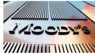
«Moody's Investors Service» халықаралық рейтинг агенттігі ҚМГ кредит төлеу қабілетінің рейтингін өзіндік негізде «Ba2» деңгейіне дейін жоғарылатты