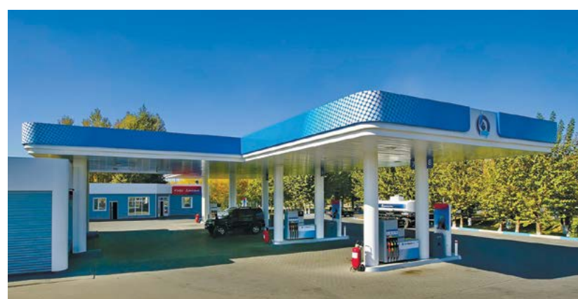
«ҚазМұнайГаз» жанар-май құю стансалар желісі сатылды