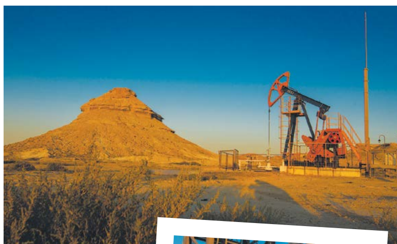
«Өзенмұнайгаз» акционерлік қоғамына – 55 жыл!