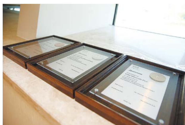
«ҚазМұнайГаз» ҰК АҚ 100 ең ірі компания арасынан ашықтық рейтинг бойынша екінші орын алды