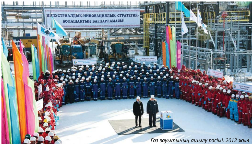
Газ зауытының ашылу рәсімі, 2012 жыл

– 2019 жылғы 25 шілде – біз үшін есте қалатын күн. Себебі бұл күн Компаниямыздың тарихында алтын әріппен жазылатыны сөзсіз. Осы күні жоғарыда аталған екі кен орындарын игеру басталған кезден бері 15 миллион тонна мұнай өндірілгені белгіленді. Бұл оқиғаның Қазақстан мұнайының 120-жылдығы мен «Қазақойл Ақтөбе» ЖШС 20-жылдық мерейтойымен тұспа-тұс келгені өте қуантарлық жәйт! Орын алып отырған жетістік – ең алдымен Компания қызметкерлерінің күн сайынғы қажырлы еңбегі, жоғары кәсіби шеберлігі мен ауызбіршілігінің нәтижесі. Біз осы қарқынмен табысымызды молайту үшін барынша жұмыстанып, еліміздің экономикасының дамуына үлес қосып, халқымыздың әл-ауқатын көтереміз, – деп атап өтті «Қазақойл Ақтөбе» ЖШС бас директоры Ринат Измұханбет.