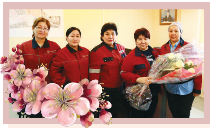
Деніңізге саулық, отбасыңызға амандық, жұмысыңызға табыс тілейміз!

«Өзенмұнайгаз» АҚ, ТТБ бір топ қызметкерлері: